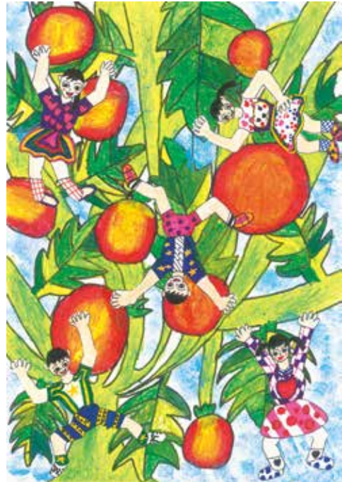
「楽しい楽しい ミニトマト公園」

評 大きなアサガオに目をつむって寝ころび、気持ちよさが伝わってきます。花や葉、太陽と細かく形を捉え、色を重ねて丁寧に塗り込み、魅力のある作品になっています。