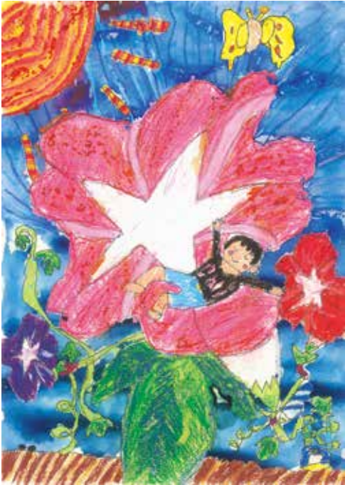
「アサガオのうえでねてきもちいいよ」