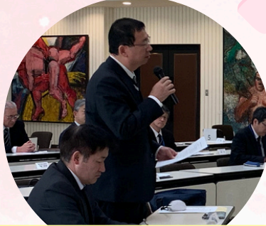
在籍校校長先生のお話