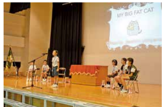
英語スピーチコンテスト 優勝者のパフォーマンス