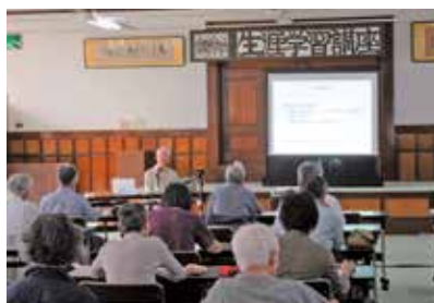
熱心に学ぶ参加者