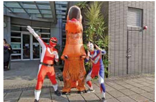
ハロウィン当日の校長、教頭、教務主任です。