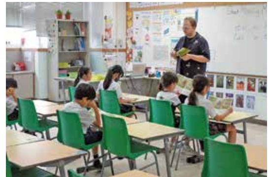
日々の英語の授業の様子です。

このようにたくさんの生の英語に触れさせながら学習をしている根底には世界に通用する国際人を育てたいという学校としての理念、保護者の願いがあります。英語教育に力を入れるだけでなく、様々な教科の学習を通じて子どもたちに世界を相手に渡り合っていけるような生きる力を育んでいきたいと思ひます。