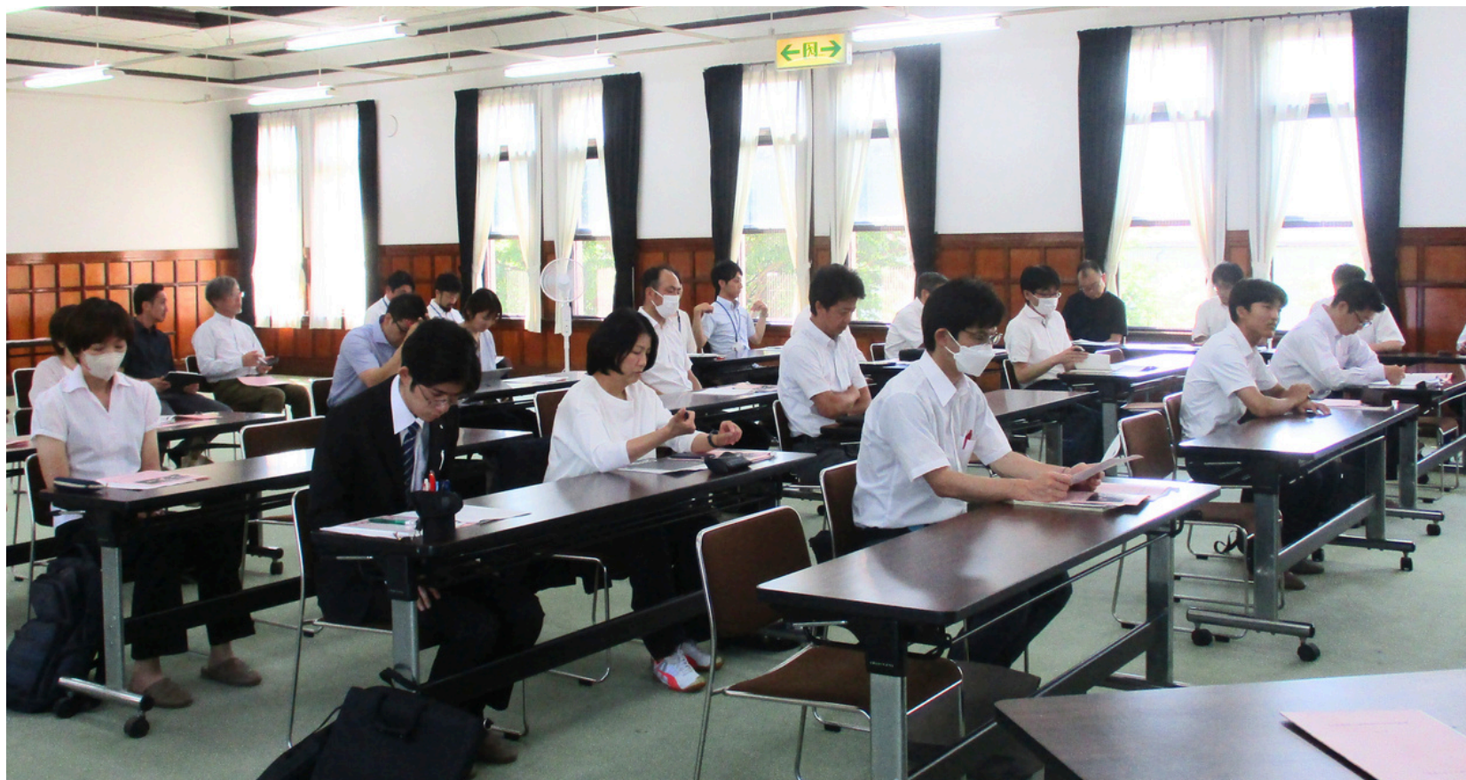
生涯学習センター 全体会の様子