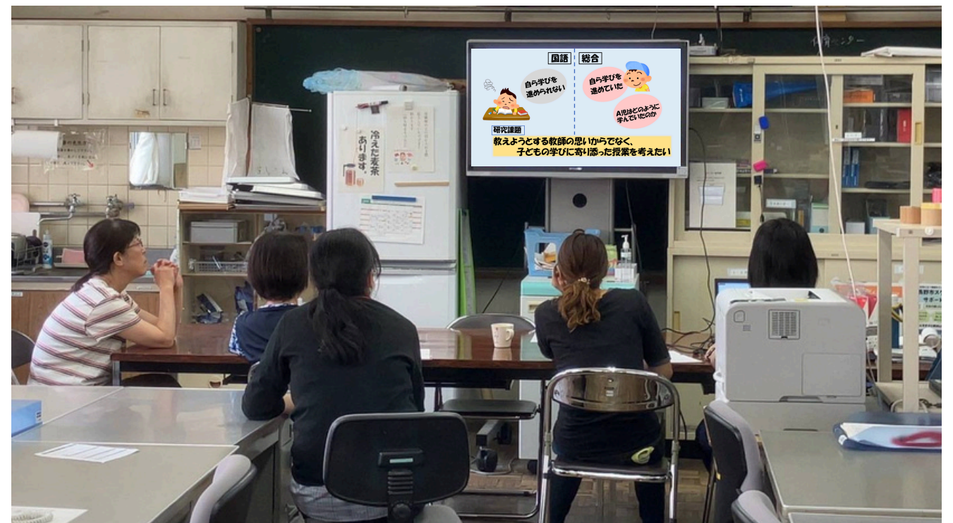
画面共有をして研究成果を発表する様子