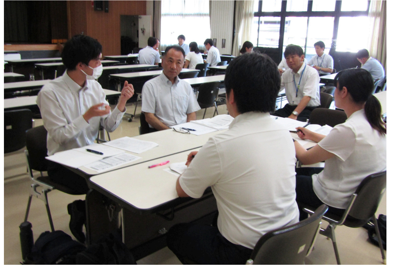
信濃教育会館 分散会の様子

発表を聞いた後は、参加者の先生同士で研究内容のことや、日ごろの悩みについてどのグループも熱く語り合い、充実したグループ協議が行われました。